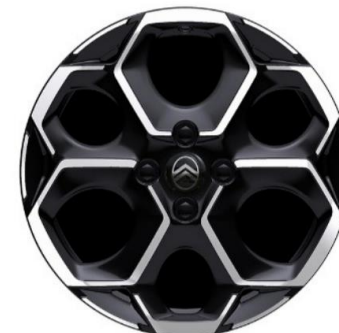
17" aliaj MAX