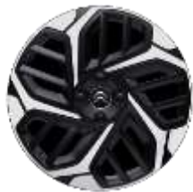
Jante aliaj diamantate 18" CAMÉLIA (195/60 R18)