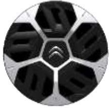
Jante tabla 18" LOKI (195/60 R18)