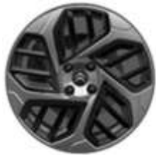
Jante aliaj Gris Anthra 18" CAMÉLIA (195/60 R18)